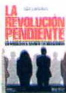
Autor: Juan Luis Urcoia Editorial: ESIC